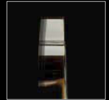
Ancho de caja