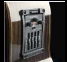
Prefix. Pro. Blend