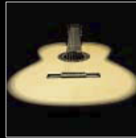
Figura de la caja

Elija entre la figura Número 1, Número 2 y Señorita. El Ancho de caja está disponible en 92 mm, 97 mm y 99mm.